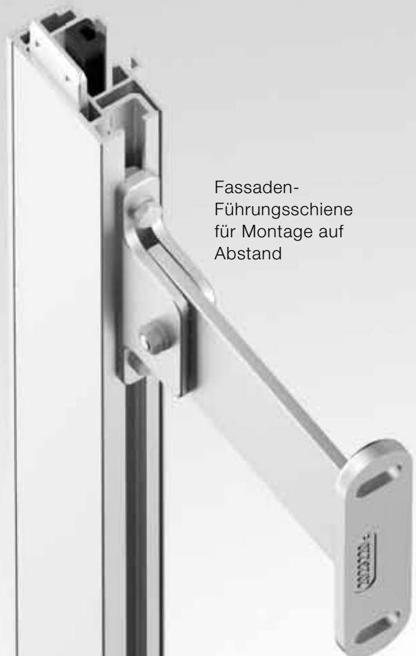
Fassaden-Führungsschiene für Montage auf Abstand